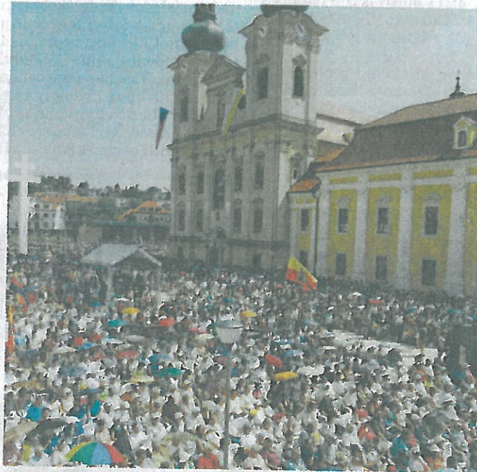
HLAVA NA HLAVĚ. Velehradské nádvoří bylo plné.

Kardinál Miloslav Vlk pak ve svém proslovu vzpomněl